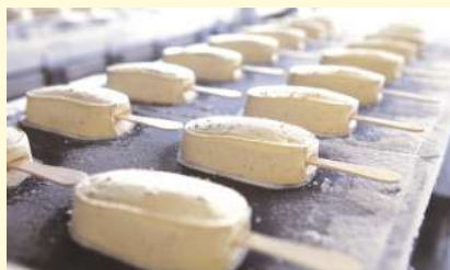
Bild: Produktionsstrecke bei R&R Ice Cream

Die Sonne brennt, die Luft schwirrt und die Menschen schwitzen... jetzt ein schönes, kühles Eis denkt sich Susanne* und greift in ihren Tiefkühlschrank.